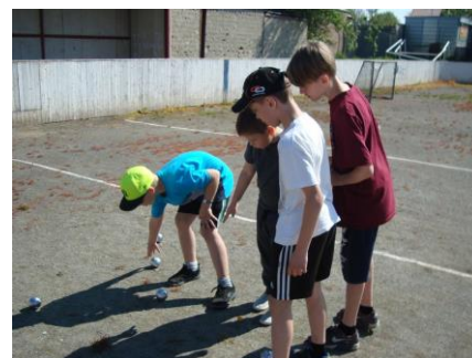
Turnaj v Jiříkovicích