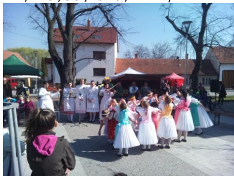
Farmářské trhy Ostopovice

Datum: 3. 3. 2018 od 8 do 12 hodin na návsi obce Ostopovice. (Další termíny trhů: 7. 4., 12. 5., 8. 9., 13. 10., 24. 11.)