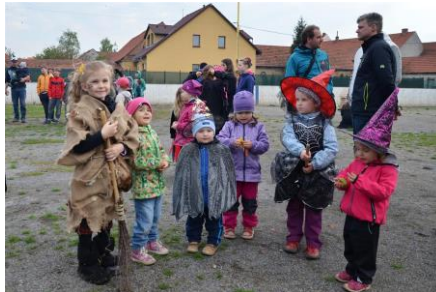
Čarodějnice v Jiříkovicích