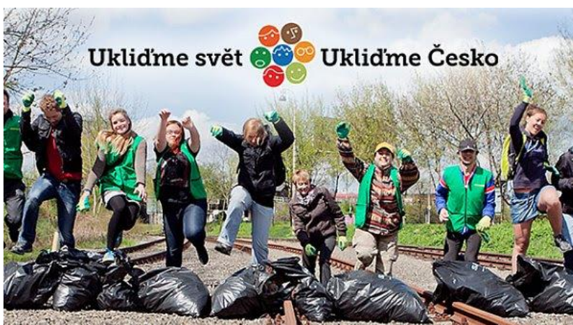
Uklidme svět, uklidme Česko

Na webových stránkách je k dispozici interaktivní mapa úklidů za rok 2015, 2016, 2017 i 2018 s legendou, která určuje typ úklidu – obecní úklid, školní úklid, černá skládka atd. Pod mapou je seznam obsahující datum, název akce, typ, organizátora a volnou kapacitu. Na stránkách se také dočtete vše o tom, jak se zapojit jako organizátor, jako dobrovolník, jaké budou Vaše povinnosti a s čím vším Vám spolek pomůže.