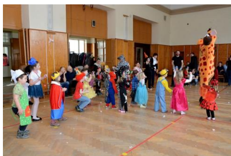
Dětský maškarní ples