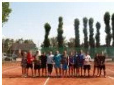
Tenisový turnaj Telnice